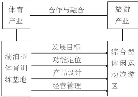
图 2. 湖泊型体育训练基地旅游化开发模式基本框架图

利用基地在体育市场的知名度及所在地带的空间和资源优势,开发出以湖泊空间为载体、以水文化为主要特色、以休闲运动为主题、类型多样的旅游活动项目,满足旅游者的赛事(或训练)观赏、运动健身、竞技比赛、休闲娱乐、康体养生、探险刺激、素质拓展、学习交流等多方面多层次的需求,寓体育于娱乐、寓旅游于健康之中,引导更多人群进行体育旅游消费。